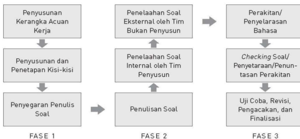
Gambar Tahapan Pengembangan Soal SM UNY

Secara rinci tahapan pengembangan soal dapat dijelaskan sebagaimana gambar berikut.